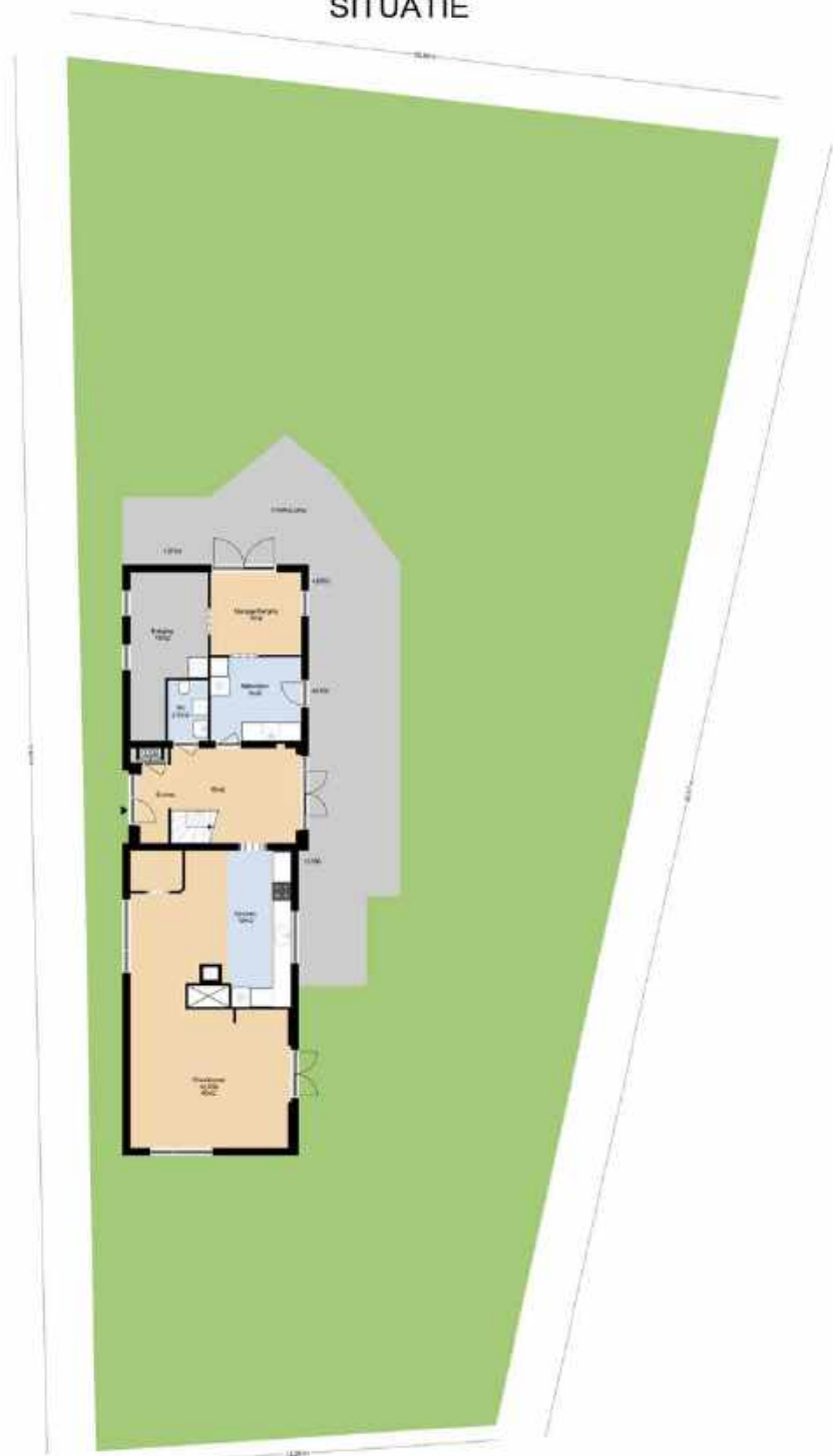
TIENDWEG 4 SITUATIE

DEZE PLATTEGRONDEN ZIJN MET DE GROOTSTE ZORG SAMENGESTELD EN DIENEN TER INDICATIE. ER KUNNEN GEEN RECHTEN AAN WORDEN ONTLEEND. © WWW.DROOMHUIS360.NL