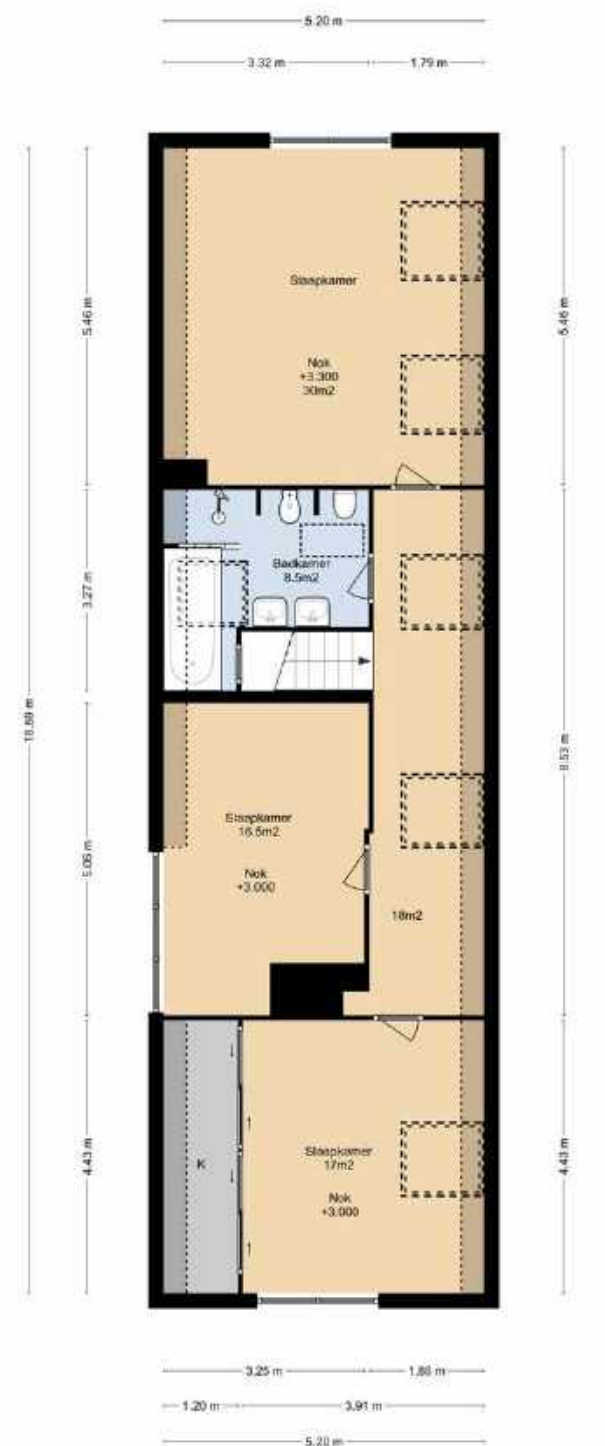
TIENDWEG 4 1E VERDIEPING

DEZE PLATTEGRONDEN ZIJN MET DE GROOTSTE ZORG SAMENGESTELD EN DIENEN TER INDICATIE. ER KUNNEN GEEN RECHTEN AAN WORDEN ONTLEEND. © WWW.DROOMHUIS360.NL