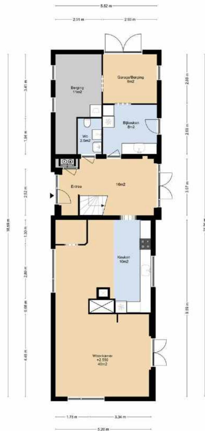
TIENDWEG 4 BEGANE GROND

DEZE PLATTEGRONDEN ZIJN MET DE GROOTSTE ZORG SAMENGESTELD EN DIENEN TER INDICATIE. ER KUNNEN GEEN RECHTEN AAN WORDEN ONTLEEND. © WWW.DROOMHUIS360.NL